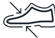
Odere un ieliekamā saistzole